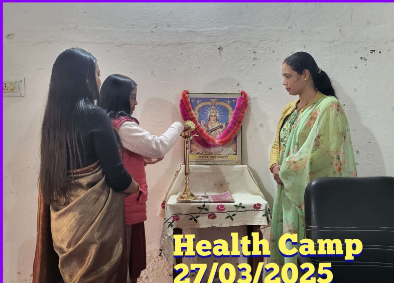
Health Camp 27/03/2025